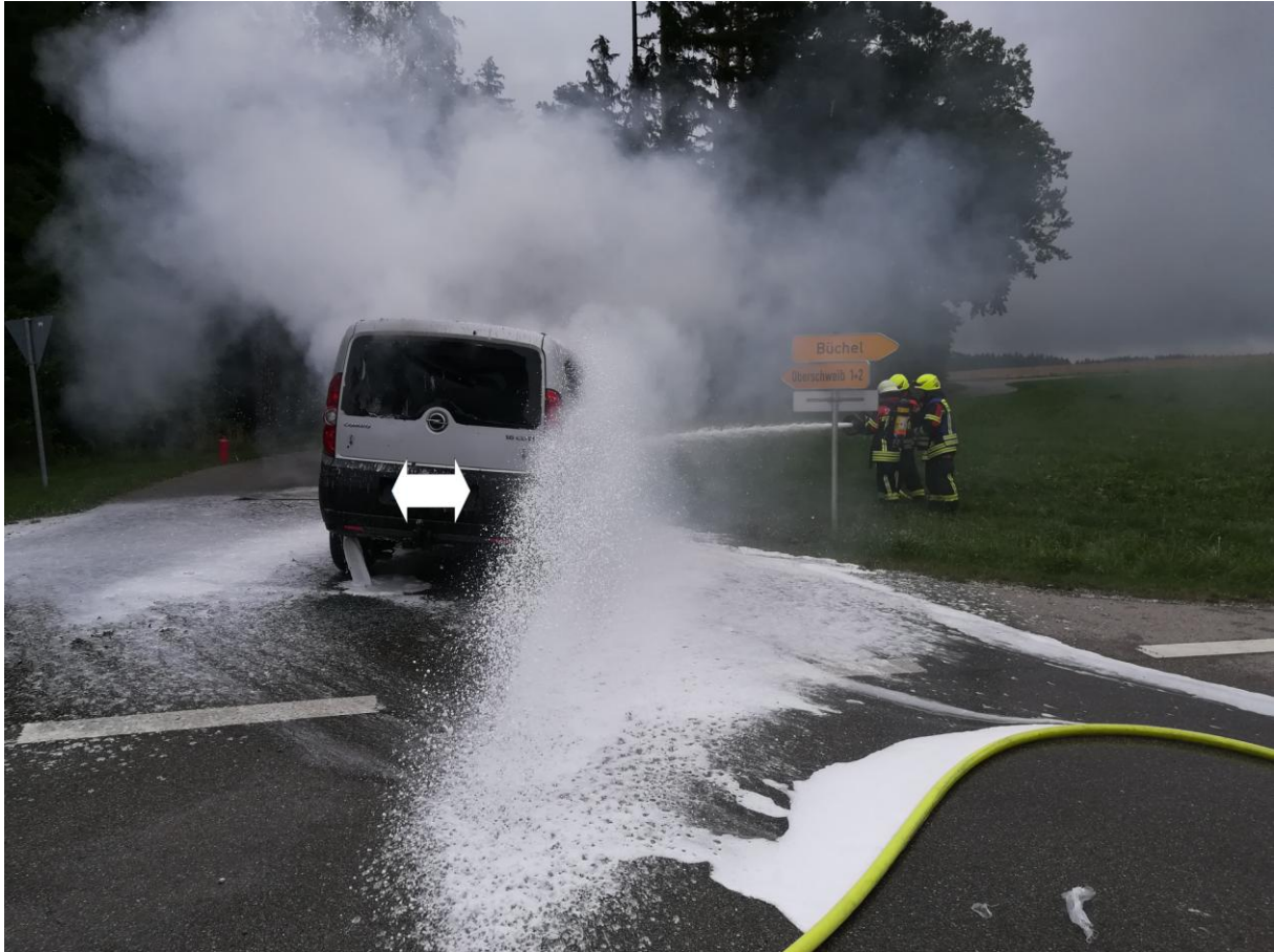
Das Fahrzeug wurde mit Atemschutz und Schaummittel gelöscht.