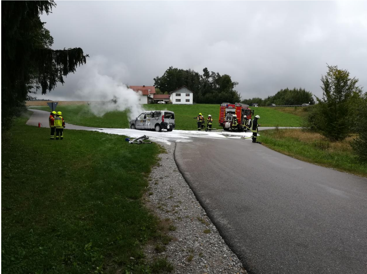
Nach eineinhalb Stunden waren wir fertig und wieder einsatzbereit.